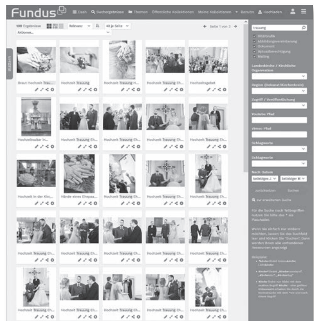
Bildersuche auf fundus.media (Screenshot)

Wichtig: Ein Nutzer-Account für Fundus kann mit einer EKM-Mailadresse kostenlos erstellt werden. Damit hat man Zugriff auf alle freigegebenen Bilder der Datenbank. Um Fotos hochzuladen, braucht man einen Uploader-Account. Um sicherzustellen, dass alle Bilder bestimmten Kriterien entsprechen, muss einmalig ein Uploader-Formular unterschrieben werden. Wir ermutigen ausdrücklich, Fundus als Bilderlager zu nutzen, da wir so alle gemeinsam von den Bildern profitieren können. Kirchenkreise und Einrichtungen, die ihre Webseiten mit dem für die EKM entwickelten Nadminstudio betreiben, können Fotos von Fundus aus direkt in die eigene Website einbinden.