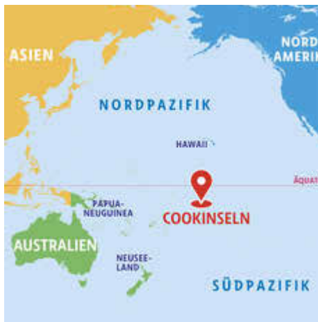
WGT - Deutsches Komitee e.V.

„wunderbar geschaffen!“ sind diese 15 Inseln. Doch ein Teil von ihnen - Atolle im weiten Meer- ist durch den ansteigenden Meeresspiegel, Überflutungen und Zyklo- ne extrem bedroht oder bereits zerstört. Welche Auswirkungen der mögliche Tief- seebergbau für die Inseln und das gesamte Ökosystem des (Süd-)pazifiks haben wird, ist unvorhersehbar. Auf dem Meeresboden liegen wertvolle Manganknollen, die seltene Rohstoffe enthalten und von den Industri- nationen höchst begehrt sind. Die Bewoh- ner*innen der Inseln sind sehr gespalten, was den Abbau betrifft - zerstört er ihre Umwelt oder bringt er hohe Einkommen.