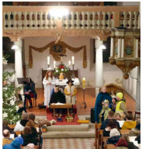
Krippenspiel in Roßdorf