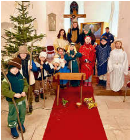
Krippenspiel in Rosa