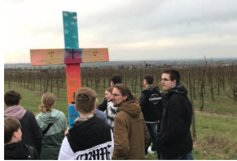
Kreuzweg der Jugend - die Konfis sind dabei

Auch der Glaube steht zur Disposition. Der Kinderglaube war noch vom unerschütterlichen, kindlichen Vertrauen auf Gott und den Impulsen aus der Familie geprägt. Wie aber soll es weitergehen, wenn junge Menschen wegen ihres Glau-