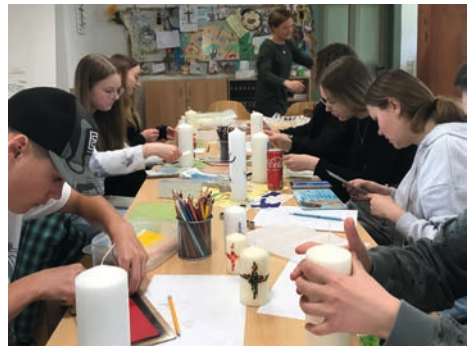
Die Konfis gestalten ihre KonfiKerze