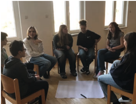
Gespräch während der KonfiFreizeit

bens aus dem Freundeskreis, von Klassenkameraden oder auch aus dem weiteren Umfeld angefragt werden. Da ist es notwendig, eine eigene Meinung zu den Dingen zu entwickeln und dazu zu stehen.