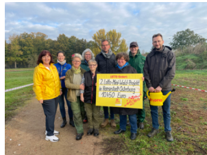
Scheckübergabe und Startschuss für das Projekt „Miniwäldchen“