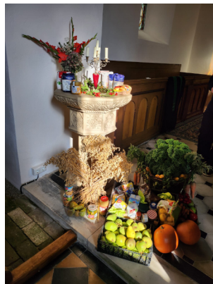
Erntedank in Grävenitz