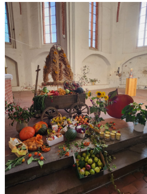
Erntedank in Osterburg