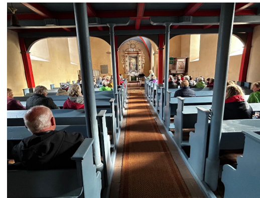
Fahrradgottesdienst von Osterburg über Storbeck und Flessau nach Rönnebeck