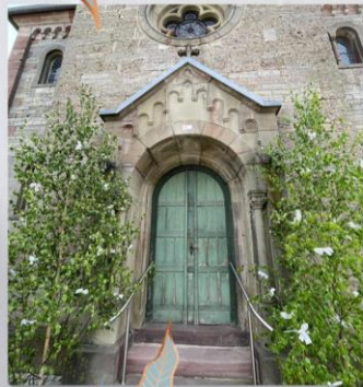
Kaltennordheim, Konfirmation 12.Mai 2024