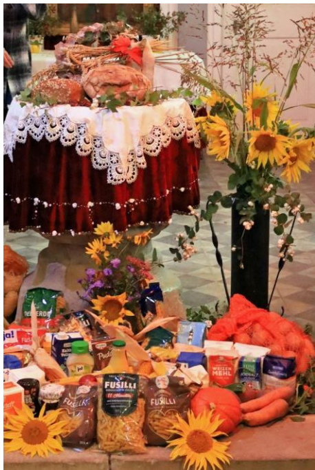
Festlich geschmückte Kirche in Frauenprießnitz