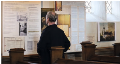
Ausstellung in der Kirche.