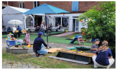
Familienfest im Juni.

Wenn auch Sie spenden und die Arbeit damit finanziell unterstützen wollen, nutzen Sie bitte die Kontonummer auf der Rückseite des Gemeindebriefs mit dem Verwendungszweck „Haus der Begegnung“. Auch Daueraufträge sind herzlich willkommen. Vielen Dank für Ihr Mittragen!