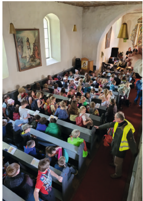
Die volle Bergwitzener Kirche.

vorwiegend von Ehrenamtlichen begleitet. Es gab Filzen, Drucken, Schatzkästchen gestalten, den Verlorenen Sohn als Film ansehen, Fußball, Jonglieren, Tischtennis, die Jakobsleiter erklettern und vieles mehr. Natürlich war auch einiges gegen den großen und kleinen Hunger von dem Küchenteam vorbereitet worden.