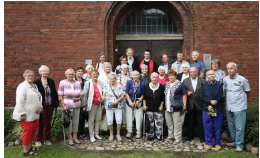
Jubelkonfirmation Dabrun.