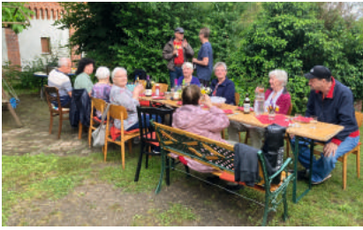
Sommerabschluss Gesprächskreis.