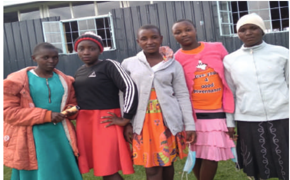
Mädchen aus dem Kinderheim.