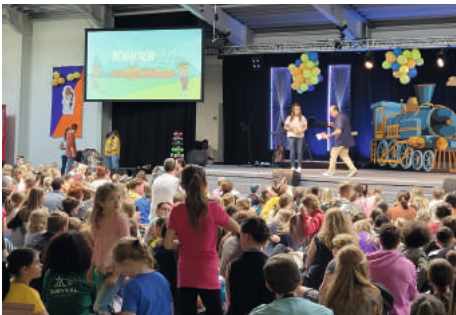
Bühne der Kinderkonferenz.

Im Mai hieß es wieder: Auf zur Kinderkonferenz nach Bad Gansdersheim. Nach drei Stunden Fahrt sind wir wieder herzlich empfangen worden. Mit Abendbrot zubereiten, gemeinsamen Spielen, Abendandacht und Schlafplatz aufbauen war dieser Tag schnell vorbei. Am nächsten Tag besuchten wir zunächst einen Gottesdienst zu Himmelfahrt im Kurpark, gefolgt von einem Spaziergang rund um den Kurparksee. Gleich nach dem Mittagessen startete endlich die Kinderkonferenz. Schnell fanden sich die Kinder in den Gruppen zurecht, sangen, tanzten, spielten Spiele und lasen in der „Powertime“ gemeinsam in der Bibel. Am Nachmittag machten wir einen Abstecher in einen kleinen Barfußpark, wo die Kinder viel Spaß hatten.