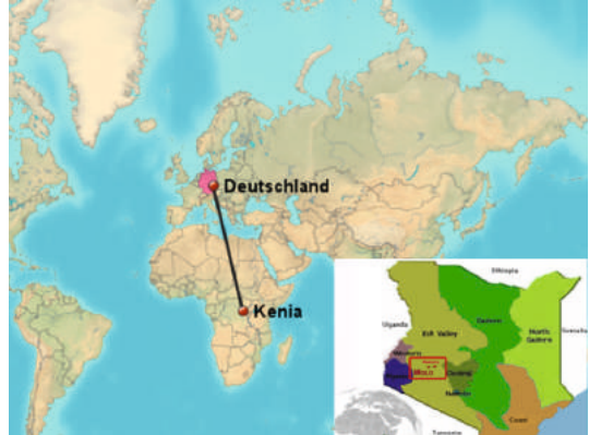
Molo in Kenia.