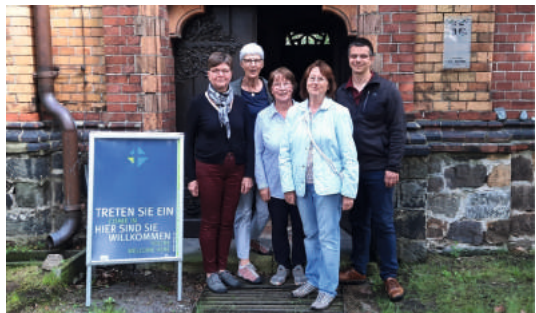
Team „Offene Kirche Wartenburg“.