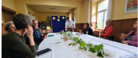
Versammlung in Wartenburg.

In Dabrun trafen wir uns am 8. Juni nach dem Gottesdienst. Bei Kaffee und Kuchen saßen