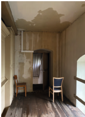
Wasserschaden in der Kirche.

gezogen. Auf dem Friedhof sind etliche Bäume abgeknickt und haben zum Teil massive Schäden an den Gräbern verursacht. Auch beim Pfarrhaus gab es zwei große Löcher im Dach und abgerissene