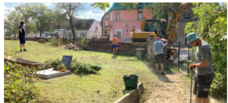
Einsatz auf dem Friedhof.