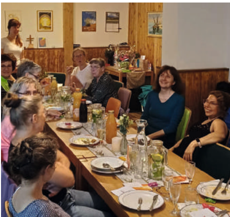
Gemeinschaft bei gutem Essen.