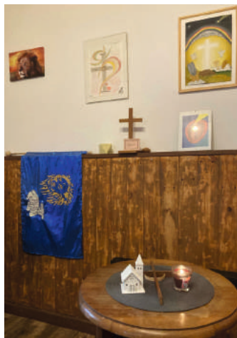
Gebetsecke in den Lebensräumen.

Gerne nehmen wir persönliche Anliegen in unsere Fürbitte mit auf.