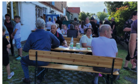
Gut besuchtes Familienfest im Juni.