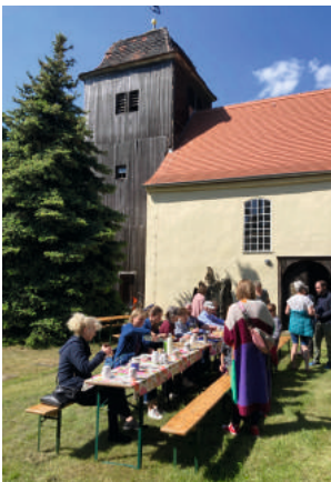
Himmelfahrt Bleddin.