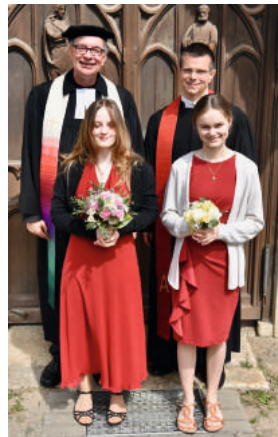
Konfirmation Eutzsch.