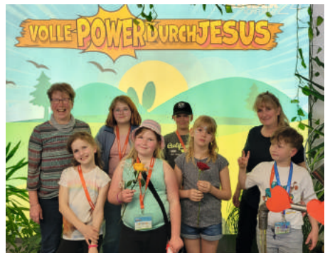
Die kleine Reisegruppe.