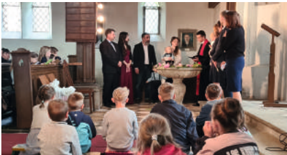
Taufen in Wartenburg.