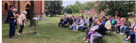
NABU-Auszeichnung in Wartenburg.