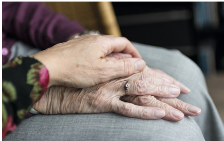
Berührung und menschliche Nähe wirken Wunder.