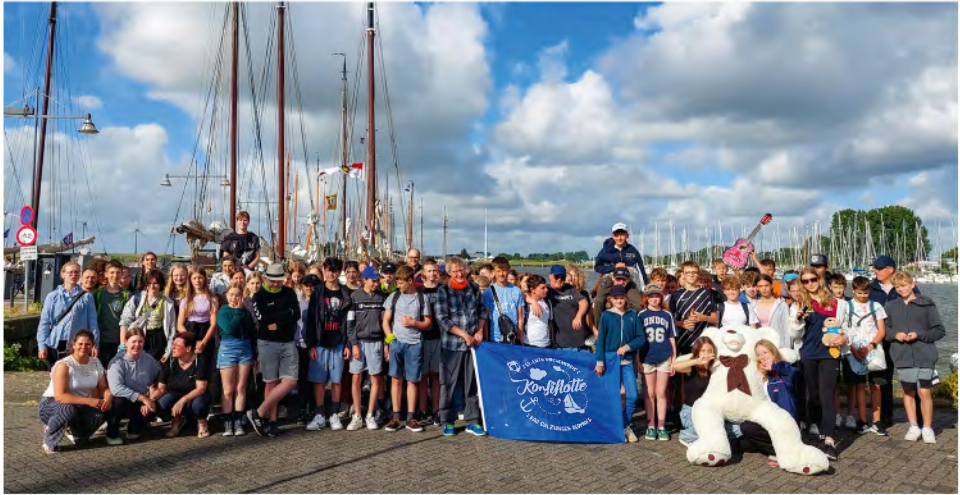
Abschlussfoto der Konfiflotte 2024 in Enkhuizen