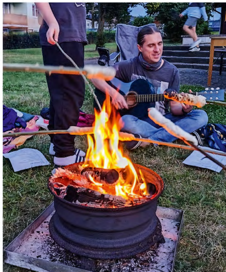
Stockbrot grillen und Lieder singen am Lagerfeuer

viele erkenntnisreiche Gesichter sorgte.