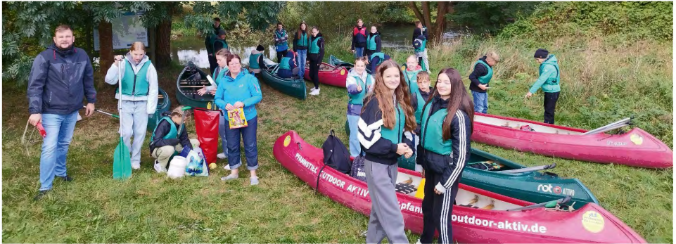
Am Einstieg in Walldorf