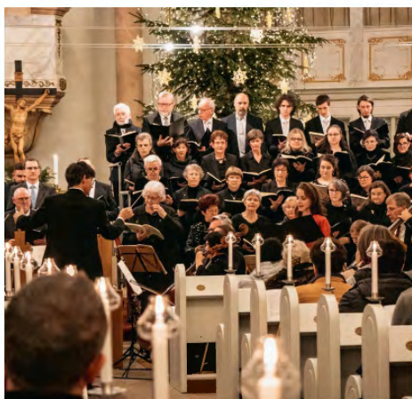
Weihnachtsoratorium Stadtkirche

Teile aus „Der Messias“ v. Händel und Weihnachtslieder zum Mitsingen