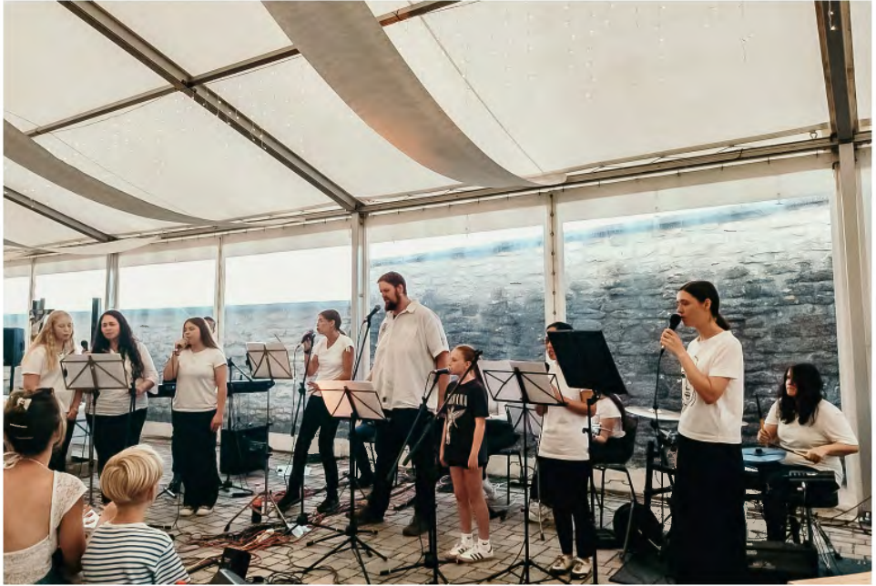
Die Bands „F.L.O.W.“ und „Tehillah“ begleiteten den Jugendgottesdienst.