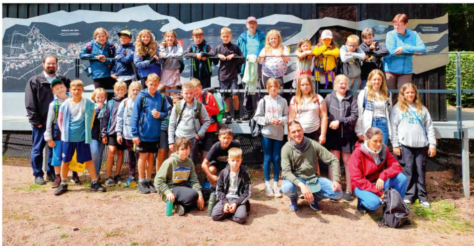
Teilnehmer KinderCamp 2024

Ein besonderer Aha-Moment war die „Schatzkiste“, in der die Kinder sich im Spiegel als Teil von Gottes Schöpfung erkannten, was für