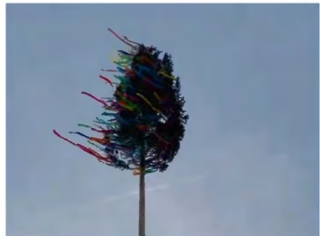
Kirmestanne in Leimbach

In Immelborn war auch Bürgermeister Ralph Groß anwesend, der im Rahmen des Gottesdienstes einen Spendenchek der Gemeinde Barchfeld-Immelborn für die Arbeit des Kirmesvereins Immelborn überreichte.