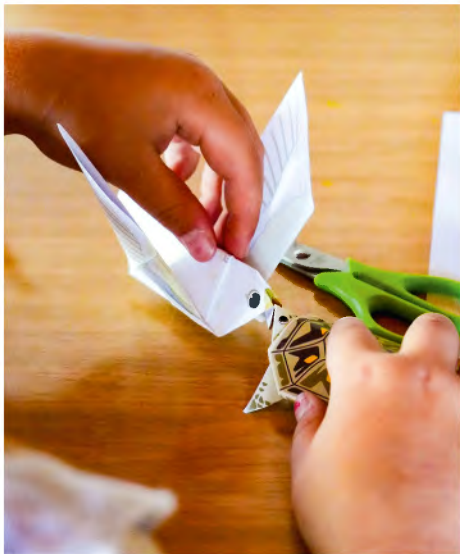
Bastelstationen zum Thema „Schöpfung“.