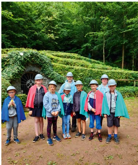
Vor dem Bergwerk in Schmalkalden-Asbach

Das diesjährige Kinder-Camp des Kirchenkreises Bad Salzungen-Dermbach bot 28 Kindern aus verschiedenen Gemeinden im Alter von 9 bis 12 Jahren ein ereignisreiches Erlebnis