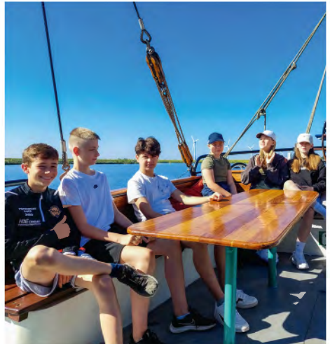
Ein Teil des Teams der „Succes“